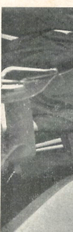
De scheidende Ondernemingsraad Maanweg in laatste vergadering bijeen

Wij wensen hem in zijn nieuwe functie veel succes.